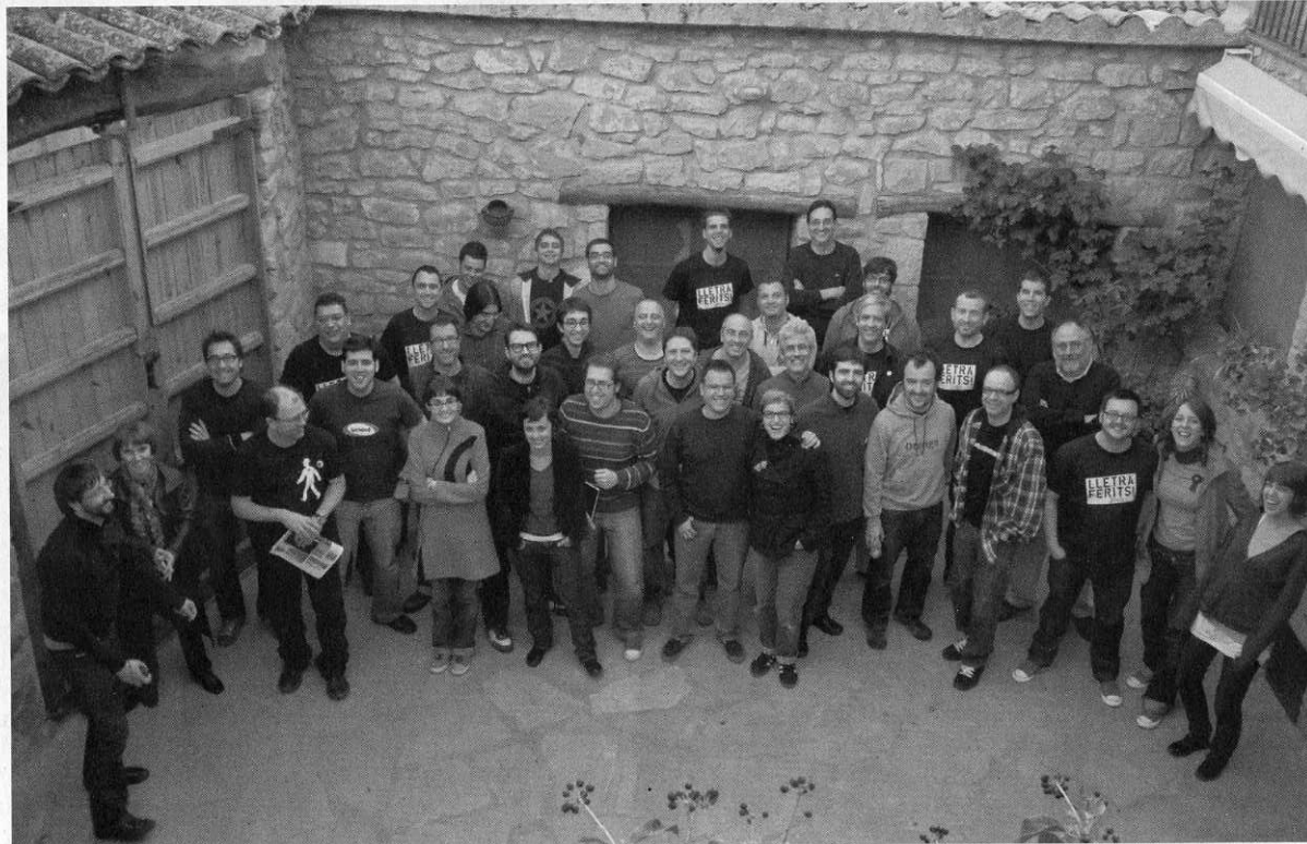
A la imatge, els tipògrafs i dissenyadors gràfics assistents a la trobada.

Finalment, es va presentar l'últim llibre de l'editorial Campgràfic Ricard Giralt Miracle: El diàleg entre la tipografia y el diseño gráfico , que,